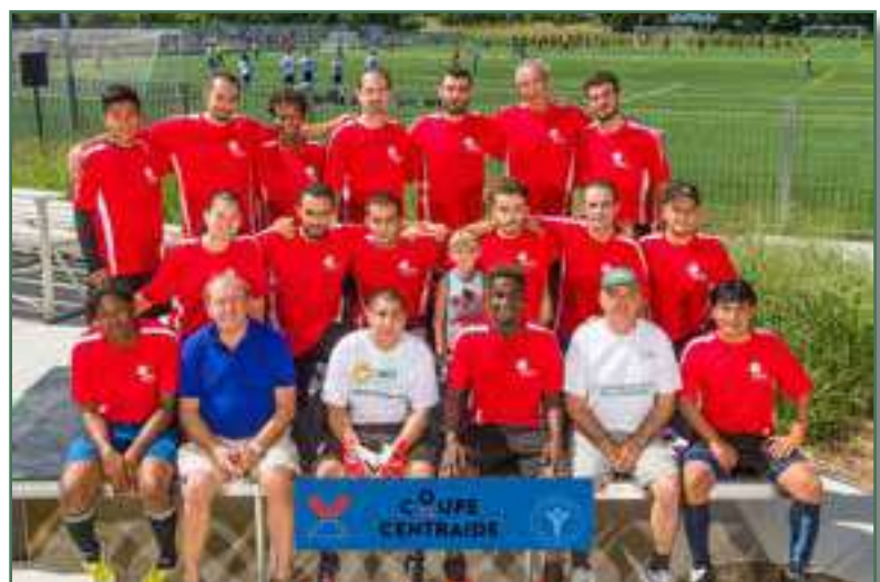
Équipe de soccer du CACI - Aout 2016

Les 27 et 28 août 2016, à la 5ème édition de la Coupe Centraide, l'Équipe Saputo était représentée par le CACI. En cette occasion, plusieurs réfugiés syriens et des employés, dont deux « dames », ont répondu à l'appel pour former l'équipe du CACI. Nous étions 20 équipes à participer à cet événement au Stade de soccer de Montréal qui a permis d'amasser 210 000 $. Une somme qui servira à soutenir et à développer des programmes notamment pour prévenir le décrochage scolaire et améliorer la qualité de vie des jeunes, des familles et des personnes plus vulnérables dans l'ensemble du Grand Montréal, selon Centraide.