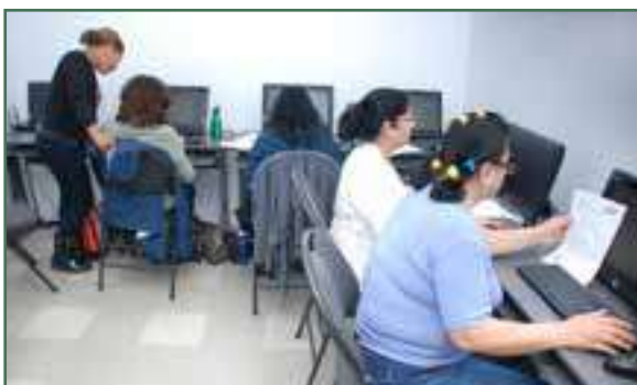
Le groupe PAAS Action en plein atelier d'informatique – Septembre 2017

Cette année, les bénéficiaires du programme ont participé à plusieurs activités en lien, entre