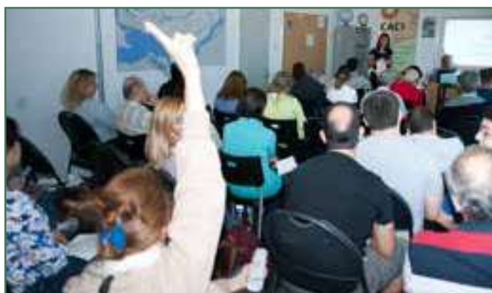
Présentation spéciale pour les réfugiés syriens – Septembre 2016

Pour 2016-2017, le CACI a continué, avec la même ferveur, son implication dans le parrainage et