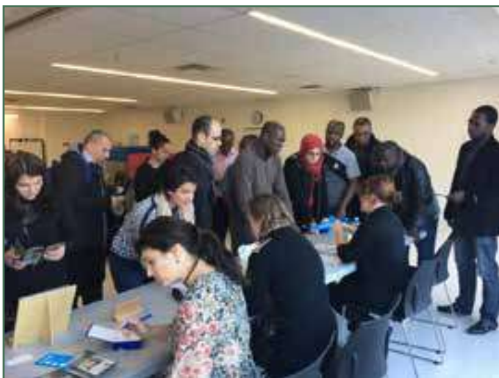
Activité du Comité interculturel – Novembre 2016