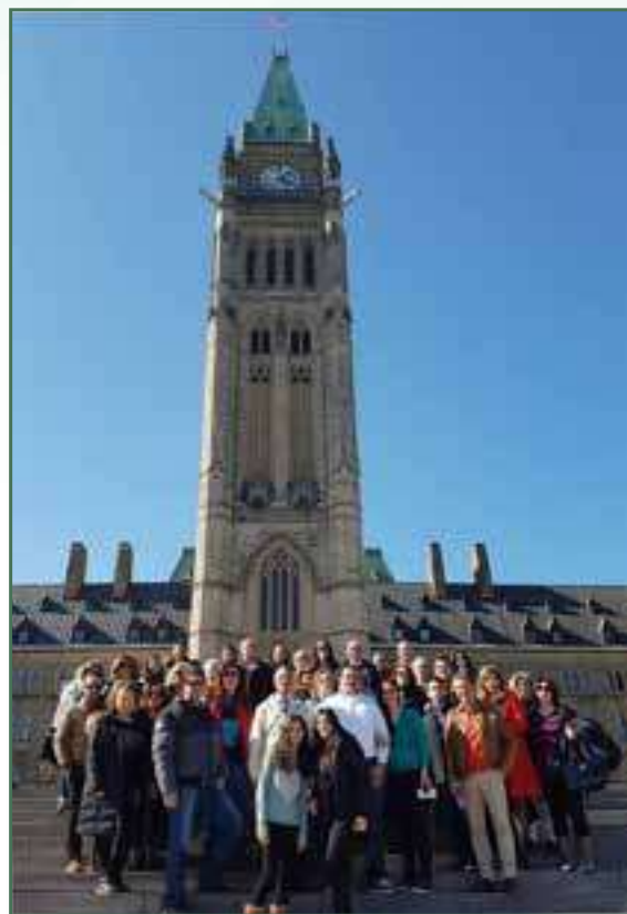
Des réfugiés syriens devant le Parlement canadien – Avril 2016

Pour cette année, la banque alimentaire a remis des