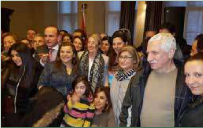
La Ministre du Patrimoine canadien, Mélanie Joly, entourée de plusieurs réfugiés syriens au Parlement – Avril 2016

cours de français. Pour répondre aux besoins de cette nouvelle clientèle, le MIDI a ouvert de nouvelles classes de français. Plus encore, Croix-Rouge Canada a distribué plusieurs cartes d'achats prépayées ainsi que le frais de transport pour faciliter l'accès au cours de français des Syriens. Plus de 500 Syriens ont bénéficié de cette aide. Le Conseil canadien des réfugiés (CCR) a pour sa part octroyé une aide financière au CACI afin de répondre aux besoins les plus urgents des réfugiés syriens. Plus de 100 Syriens ont reçu entre 50 et 500 dollars soit en cartes d'achat prépayées soit en chèque, selon les besoins des bénéficiaires.