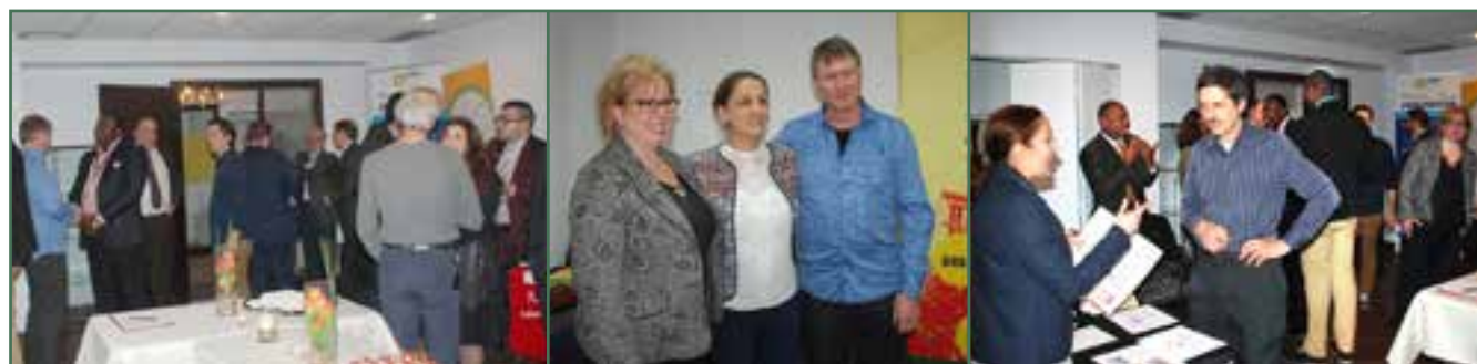
Réseautage d'affaires au CACI – Avril 2016

Le CACI a donc dépassé cet objectif jusqu'à atteindre 128 %. Pour obtenir ce résultat, le CACI a recruté