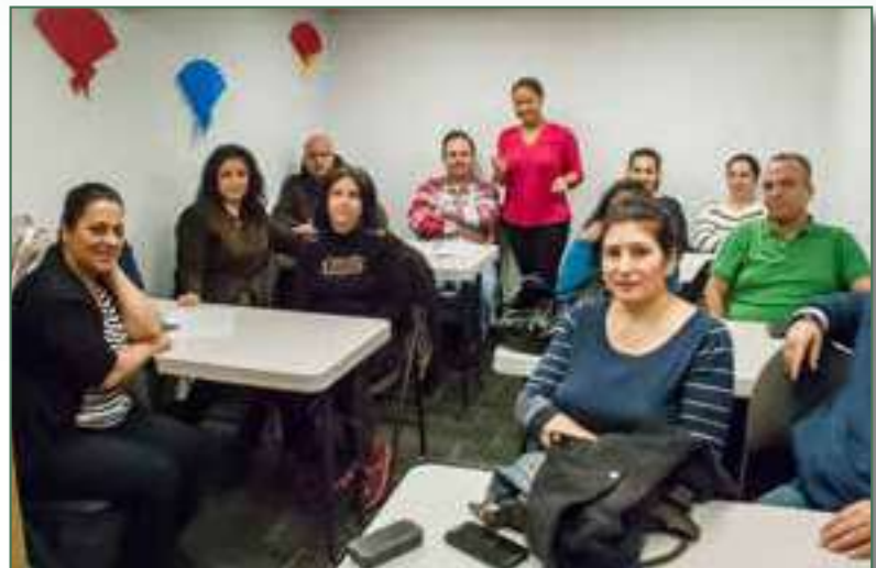
Le groupe PAAS Action et l'intervenante en atelier – Décembre 2017

Ces rencontres ont été l'occasion d'entrevues personnalisées entre les intervenants et les participants, à une fréquence régulière de 1 heure par semaine, pour évaluer l'avancement et l'atteinte des objectifs du plan d'action établi.