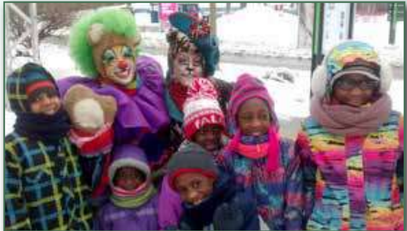
Les enfants de Maison CACI fêtent la Neige - Février 2017

Cette année un atelier de remise en forme, destiné aux parents, a été offert dans la salle communautaire de Maison CACI. En tout, 8 femmes ont participé à l'activité de Zumba qui se tenait tous les mardis de 13 h à 14 h. Par cette activité, l'idée était d'offrir aux parents, pendant les heures d'école, un moment pour l'activité physique en petit groupe.