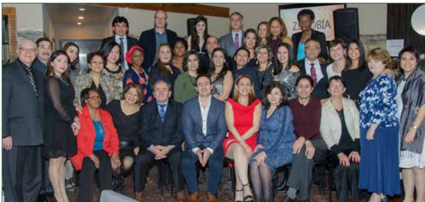
Les membres du CA, l'équipe du CACI et du Carrefour BLE – Décembre 2016