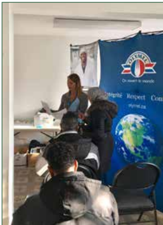
Partenariat d'affaires avec le CACI, des représentants d'Olymel font la présentation des activités de l'entreprise.

En 2016-2017, 130 personnes, divisées en 6 groupes, ont terminé leur parcours.