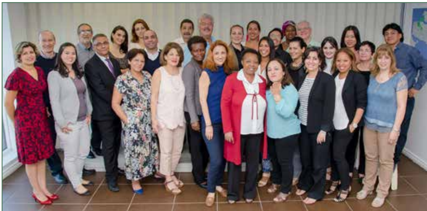
L'équipe du CACI – Septembre 2016