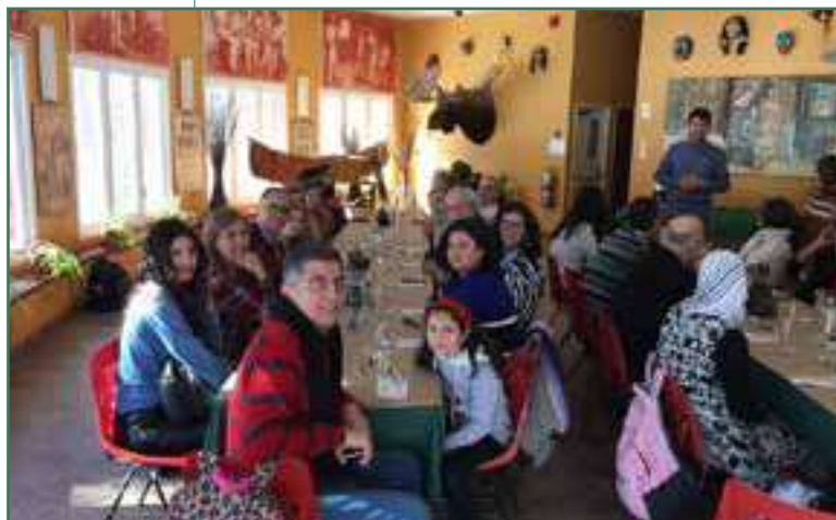
Sortie à la Cabane à sucre La Maison Amérindienne – Février 2017

Événement culturel - La 30ene de participants, tous nouveaux arrivants, ont vécu une expérience unique à La Maison amérindienne à Mont-Saint-