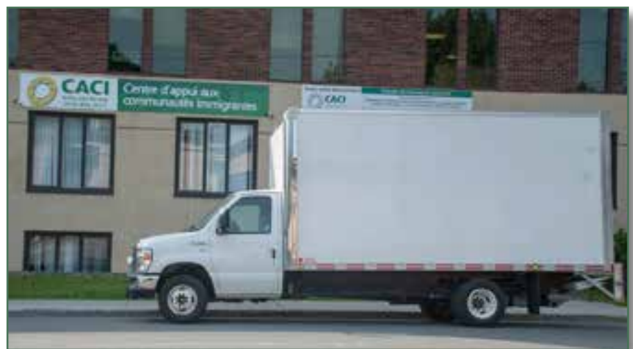
Flambant neuf ! Un camion Ford 2016 de 16 pieds - Une donation des Sœurs de la Providence - Juin 2016

2016-2017 - Les Sœurs de la Providence ont fait don au CACI d'un camion Ford 2016 de 16 pieds pour les besoins de la banque alimentaire de l'organisme. De plus, Moisson Montréal et le Supermarché IGA Extra, ont été très généreux cette année pour venir en aide aux nouveaux arrivants, particulièrement les réfugiés syriens. Grâce à leur générosité, la banque alimentaire du CACI a vu la liste de ses bénéficiaires doubler, passant ainsi de 75 à 150 familles par semaine.