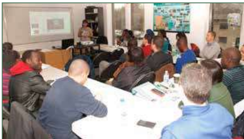
Une présentation de Forum - 2020 sur la région de St-Hyacinthe – Décembre 2016

Depuis 2015, date de la relocalisation de Carrefour BLE dans nos locaux, il s'est développé un important partenariat stratégique entre les deux organismes. Ce partenariat stratégique permet, d'une part, au CACI de développer un secteur qui lui tient à cœur, celui de la régionalisation, d'autre part, à Carrefour BLE de côtoyer la clientèle du CACI et d'en recruter des participants pour ses programmes et activités.