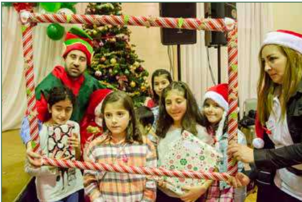
Des enfants réfugiés syriens accueillis à la Fête de Noël du CACI – Décembre 2016

L'intervenante ICSI agissait en tant qu'intermédiaire entre les parents, les enfants et l'école, afin d'aider à la compréhension des valeurs culturelles tout en facilitant une intégration complète et réussie des jeunes dans le milieu scolaire.