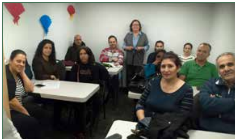
Le groupe PAAS Action en atelier et l'animatrice – Décembre 2017

Ces ateliers, donnés dans le cadre du programme de préparation à l'emploi, sont offerts en partenariat avec le Centre de ressource éducative et pédagogique (CREP-CSDM), et occupent une