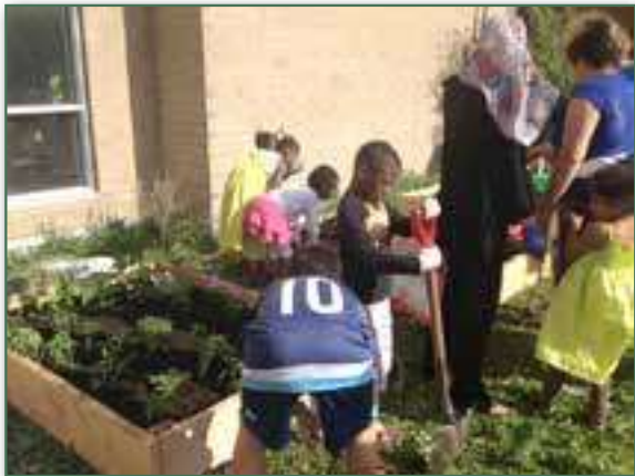
Des enfants et leurs parents font du jardinage à Maison CACI - Juin 2016

En partenariat avec Ville en vert, cette activité s'est donné comme objectif de susciter l'intérêt des