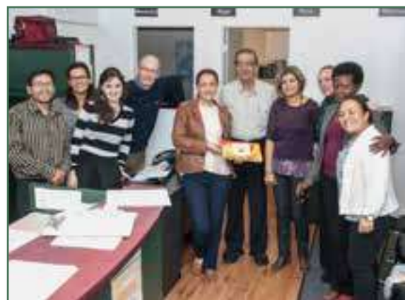
Un client satisfait entouré d'une partie de l'équipe du CACI – Septembre 2016

L'objectif de ce service est d'aider les bénéficiaires à faire le deuil migratoire le plus rapidement possible et résoudre les problèmes personnels et familiaux qui nuisent à leur intégration. Tous les clients bénéficient d'une évaluation complète de leurs besoins et ceux de leurs familles. Quand le cas le nécessite, eux ou leurs familles sont redirigés vers des ressources appropriées. Cependant, l'intervenant social chargé du dossier s'assure de suivre l'évolution des changements opérés afin de continuer l'accompagnement des clients dans leurs parcours socioprofessionnels.