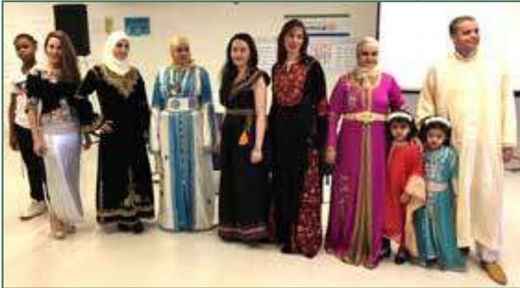
Prix de l'harmonie interculturelle - Défilé de costumes traditionnels - Mars 2017

Défilé de costumes traditionnels - Dans le cadre de la cérémonie de remise des prix de l'Harmonie