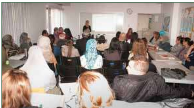
Séance d'information de la DPJ-Centre jeunesse – Août 2016