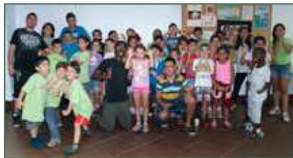
Les enfants du camp de jour du CACI – Juillet 2016

De plus, 14 bénévoles ont eu à prêter leur service lors des sorties et des festivités. Pour les adolescents moniteurs-bénévoles, c'était l'occasion idéale d'acquérir de l'expérience en animation de groupe pour une clientèle jeune. Quant aux parents, ils ont profité du camp de jour mis à leur disposition pour participer, l'esprit tranquille, aux cours de francisation du CACI et autres activités comme des visites au Musée des Beaux-arts , au Planétarium , la Grande Bibliothèque de Montréal , etc.