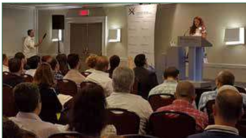
La DG du CACI au séminaire de la CCMM – Mai 2016

Une centaine de réfugiés syriens ont assisté au séminaire et ont pu