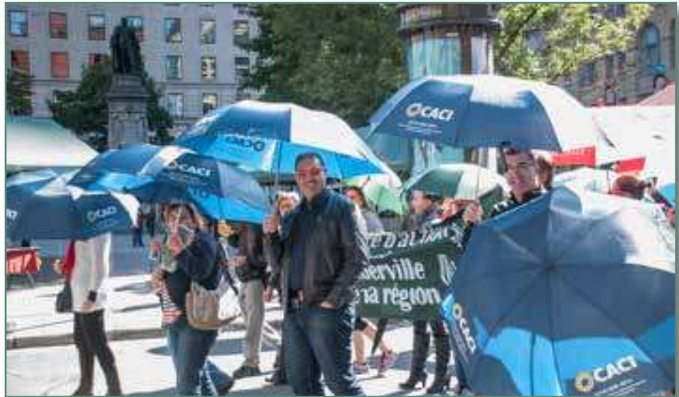
Le CACI à la Marche des 1000 parapluies de Centraide – Octobre 2016

Au nom de toute la clientèle du CACI, Merci Centraide !