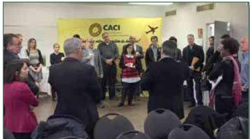
Valorisation de la langue française - Déjeuner d'affaires au CACI - Mars 2017

Déjeuner d'affaires - Notre déjeuner d'affaires a rassemblé plus de 20 entreprises dont Promenade Fleury, IGA extra Leduc, IO Solutions, l'École des entrepreneurs Mtl, Service de Marketing Goo Pages, le Fonds d'Éducation Héritage, Moment Equity, Services A Roy, Tandem et PF Design, entre autres.