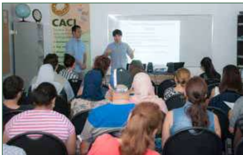
Une présentation des étudiants de l'Université de Sherbrooke sur le système de santé québécois - Septembre 2016

Pour respecter son engagement, Maison CACI, soutenu par son personnel et une équipe de bénévoles, organise plusieurs activités auxquelles ont pris part les locataires et les membres de la communauté avoisinante. Pour l'année en cours, voici les activités qui ont été réalisées :