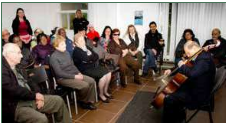
« Cœurs à l'APPUI » Prestation d'un musicien retraité – Novembre 2016

L'identification et la sensibilisation des proches aidants représentent le volet principal du projet. Un travail minutieux a été effectué pour repérer des proches aidants potentiels grâce une campagne de sensibilisation visant à communiquer de l'information sur le rôle de proche aidant. Des liens de partenariats sont créés avec différents réseaux