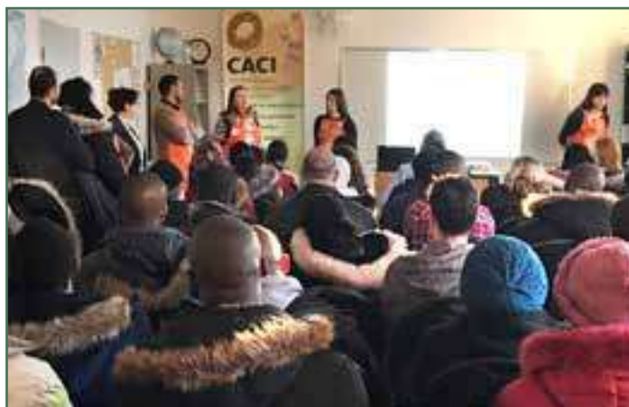
Événement embauche au CACI - Home dépôt Canada - Février 2017

L'activité « Home Dépôt Canada recrute! » a eu lieu le 17 février 2017 au CACI en présence de 120 participants. Home Dépôt embauchait pour plusieurs postes, notamment des associés aux ventes et des caissiers. À la suite de cette activité, plus de 10 personnes ont été embauchées chez Home Dépôt.