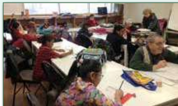
Les enfants de l'aide aux devoirs à Maison CACI - Janvier 2017

l'Acadie, à raison de 3 jours par semaine. Au total, 17 bénévoles ont consacré près de 294 heures en soutien aux devoirs scolaires assurant ainsi un temps d'étude surveillé et un accompagnement aux enfants dont les parents ne maîtrisent pas la langue française. La