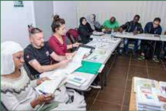
Des participants à la session Premières démarches d'installation (PDI) – Oct.2016

Cette séance intitulée « Premières démarches d'installation » se donne en 3 heures. Les nouveaux arrivants y sont orientés, dès leur arrivée à l'aéroport Montréal P. E Trudeau, par les agents du ministère de l'Immigration de la Diversité et de l'Inclusion.