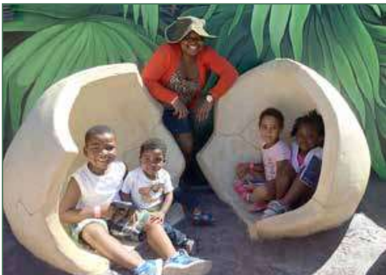
Excursion au Zoo de Granby – Aout 2016

Parmi les autres activités organisées, notons quelques sorties très intéressantes comme : la cabane à sucre, la visite à Ottawa, à Québec et aux Chutes Montmorency, le Super Aquaclub, le Zoo de Granby, le Mont-Tremblant, la cueillette des pommes, etc.