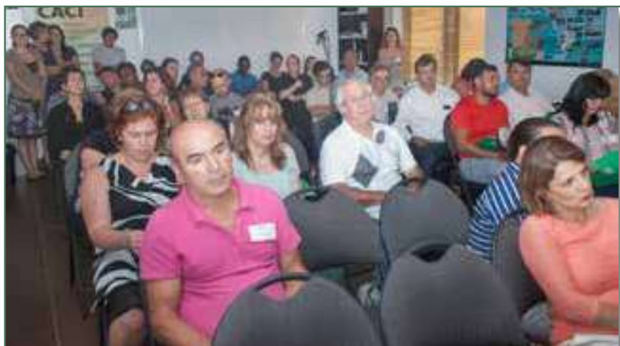
Assemblée Générale extraordinaire du CACI - Août 2016

Au fil des années, le nombre de familles accompagnées a augmenté. En 2001, le chiffre a grimpé à 800 personnes. Pour répondre à la