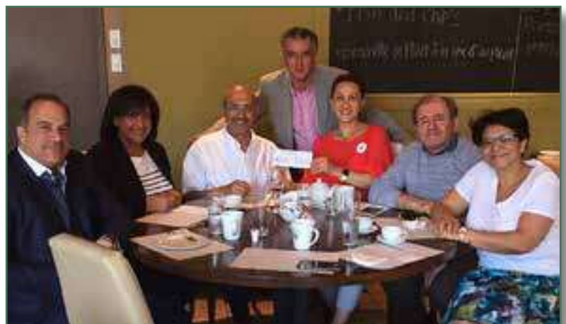
Des représentants d'Espaces Femmes Arabes et du CACI – Juin 2016