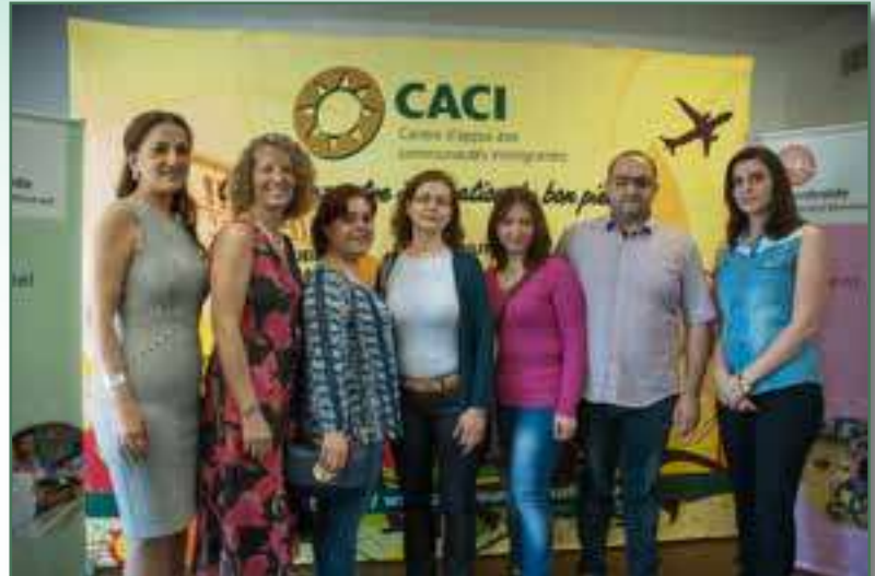
La DG du CACI, Mme Peresa de Centraide et des réfugiés syriens – Juin 2016

projets, le CACI a été soutenu par les bailleurs de fonds suivants: Centraide du Grand Montréal, MIDI, Ville de Montréal, Croix-Rouge Cana-