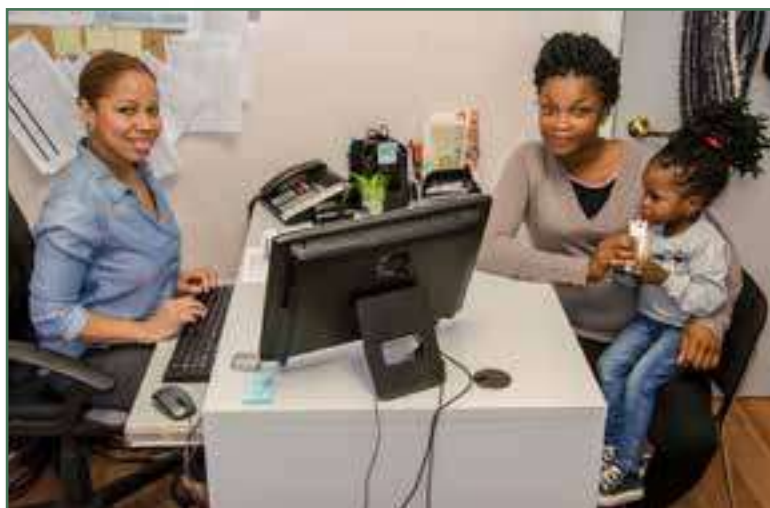
Une participante au programme SIPPE et l'intervenante – Novembre 2016

Grâce au service de halte-garderie du CACI, disponible pour les enfants âgés de 2 à 5 ans, et à celui de la Maison de la famille, pour les enfants de 0 à 2 ans, les parents ont pu participer aux différents ateliers sans avoir à se faire du souci.