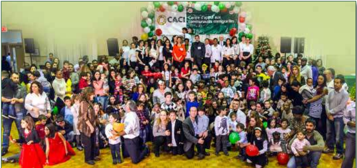
Mamans, papas et enfants, des participants aux différents programmes du CACI présents à la fête de Noël organisée pour la clientèle - Décembre 2016

Ce programme est financé par la direction de la Santé publique de la région de Montréal en partenariat avec le Centre intégré universitaire de santé et des services sociaux du Nord-de-l'Île-de-Montréal - CIUSSS).