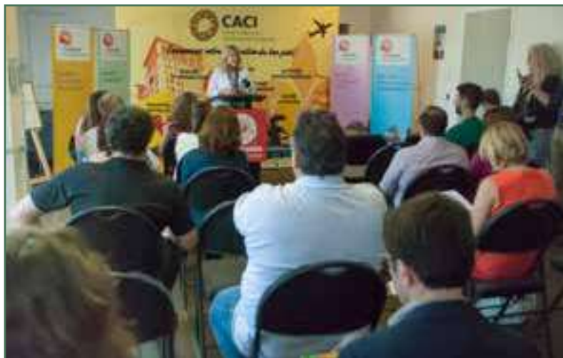
Conférence de presse de Centraide au CACI – Juin 2016

15 juin 2016 – Centraide du grand Montréal, partenaire privilégié du CACI, avait choisi nos locaux pour annoncer un investissement supplémentaire de 1 M$ sur 5 ans destiné aux organismes de son réseau qui interviennent auprès des réfugiés syriens. Une annonce qui a