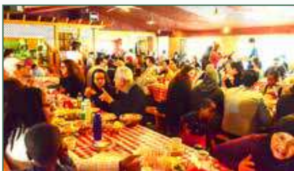
Sortie à la cabane à sucre – Mars 2017

Pour l'année 2016-2017, avec l'implication de plusieurs bénévoles, le CACI a organisé 6 activités familiales au profit de la clientèle, dont la grande fête traditionnelle de Noël.